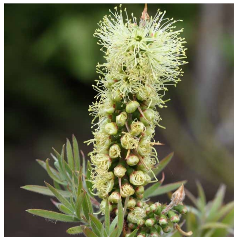
Callistemon 'Haverling Gold'