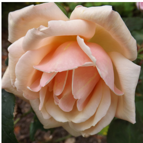
Rosa 'Janet' (Dickson, NI 1915)