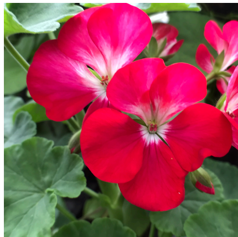
Pelargonium 'Winston Churchill'